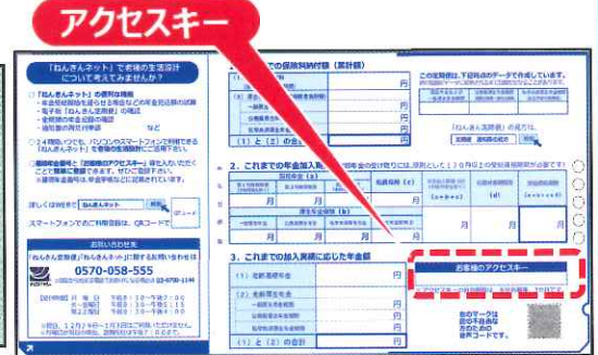
■ねんきん定期便 (50歳未満ハガキ)