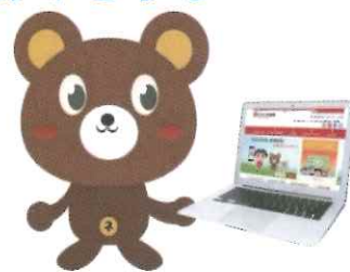
ねんきんクマ 「ねんきんネット」マスコット